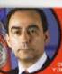
Miguel Ángel Serna

CONSEJERO DE EDUCACIÓN, CULTURA Y DEPORTE DEL GOBIERNO DE CANTABRIA